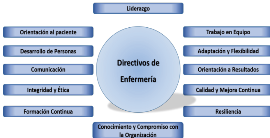
Figura 3. Competencias que deben poseer los directivos en el área de la Salud según la sociedad Española de Directivos de la Salud. Elaboración propia.

En general para la mayor parte de enfermeras y enfermeros que componen equipos directivos y más concretamente para todos los mandos intermedios (supervisoras, coordinadoras, jefes de equipo, área, subdirectoras, equipos de staff, profesionales de referencia, etc.) que tienen o conforman equipos operativos a su cargo, la dirección de personas es un reto continuo que exige importante conocimiento, voluntad y trabajo pero que, si se le presta la atención precisa, una gran parte de los resultados se tornan satisfactorios y por ello se convierten en si mismos, en un estímulo que retroalimenta la continuidad de los esfuerzos realizados.